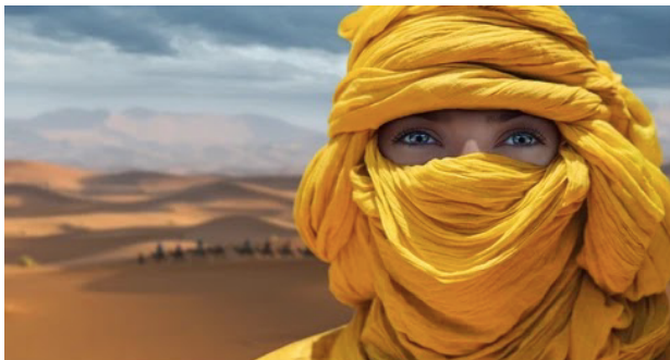
Inspiration pour un costume de touareg