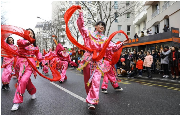
Inspiration pour les couleurs et un ruban autour d'un carnaval asiatique

Si le dôme et le plateau tournant invitent déjà les spectateurs au voyage, la scénographie de l'ensemble du spectacle ne doit pas être laissée en reste. Chaque étape du voyage de Rita sera l'occasion de proposer au public un tableau immersif. Plusieurs pistes sont en cours de réflexion et un travail de recherche sur chacune d'elle sera mené lors des temps de résidence : le désert marocain et les touaregs, un carnaval asiatique, les tribus aborigènes australiennes et les rainbow serpent, les inuits et la tradition du katajaniq (chant de gorge). Ces tableaux seront symbolisés par plusieurs accessoires, costumes ainsi qu'un travail de lumière et de son. La comédienne se mettra alors dans la peau des peuples rencontrés par Rita par le jeu théâtral, la danse, le chant ou les arts visuels (plastiques notamment).